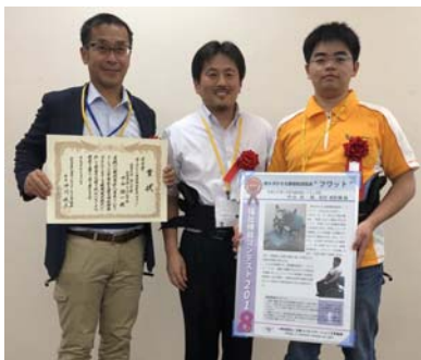
福祉機器コンテスト2018で 優秀賞を受賞しました