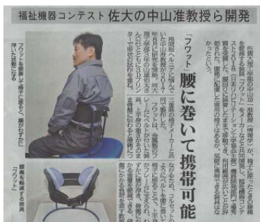
西日本新聞で 紹介されました