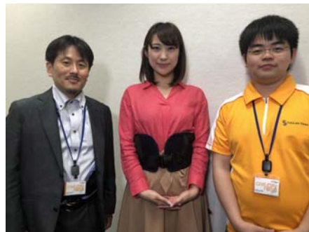
テレビ東京「WBSTれたま」 で紹介されました